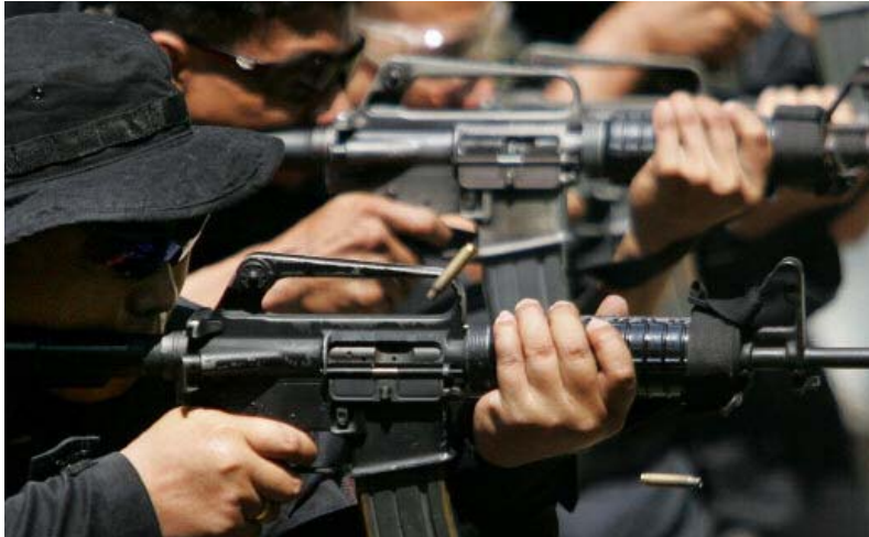
Mitglieder einer Spezialeinheit der Polizei trainieren im Juli 2005 den Gebrauch von Sturmgewehren im Camp Bagong Diwa, dem Polizeicamp von Manila. Das Militär rekrutierte 3000 neue Soldaten im Verlaufe des Jahres 2008, um den kommunistischen Aufstand zu brechen.

Im Verlaufe des Jahres 2008 erzählten Zeugen Amnesty International, dass sie lieber ihre Häuser verlassen hatten oder Schutz in Kirchen suchten, als das Zeugenschutzprogramm in Anspruch zu nehmen.