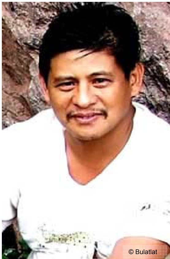
Rafael Markus Bangit, Indigenenführer, ermordet am 18. Juni 2006

Zusammengestellt durch die Philippinenkoordinationsgruppe von amnesty international Deutschland. Verbindlich ist die englische Originalfassung